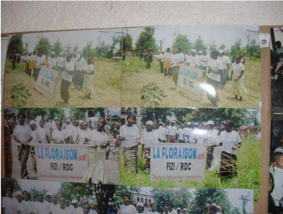
Image montrant les jeunes femmes membres de l'organisation La Floraison en défilé sur la journée de 08 mars 2011 à Baraka centre.