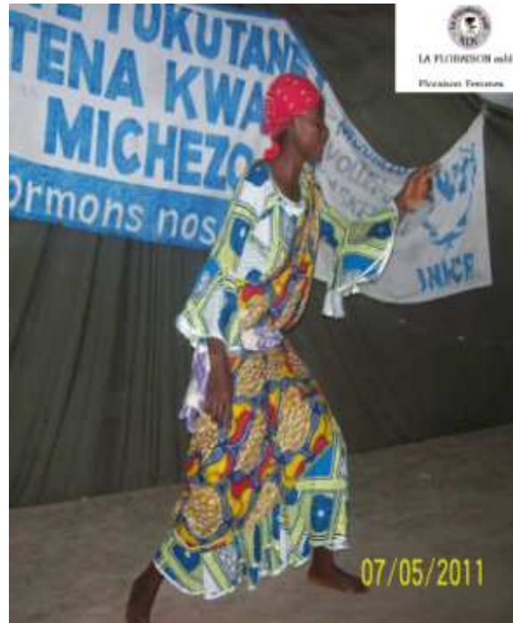
Image montrant les jeunes filles élèves participant à l'activité de concours culturel organisé par La Floraison à Baraka dans la salle de l'Espace culturel WOTE TUKUTANE TENA du Centre Lokole. 1 ère image : lecture des ouvrages 2 e image : déclamation poème.