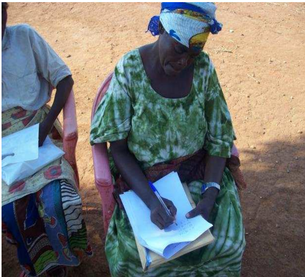
Image montrant les femmes membres du groupe d'autonomisation des femmes de Sebele apprenant à lire et à écrire.