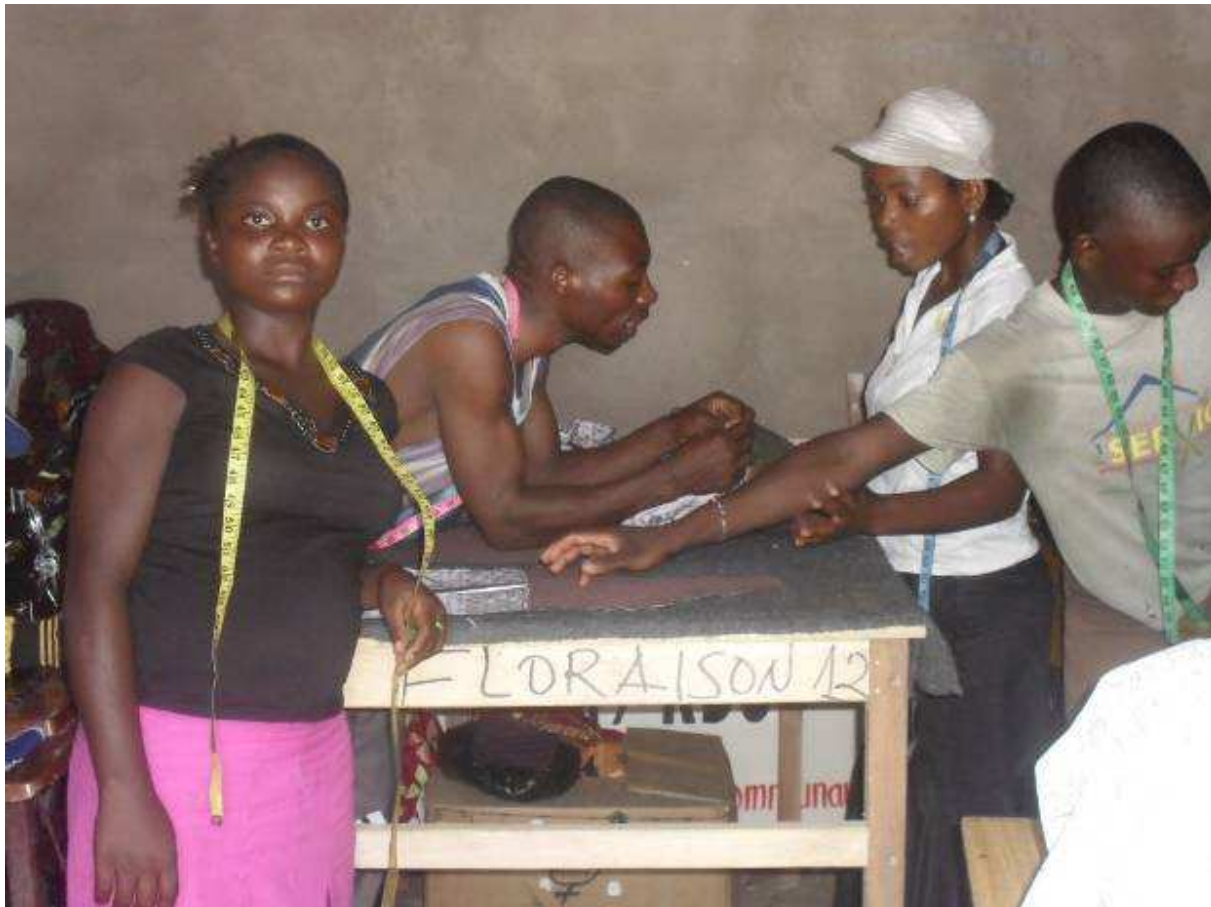
Filles-mères et enfants ex-combattants démobilisés apprenant le métier de la coupe et couture au centre de formation professionnelles des jeunes ouvert par La Floraison à Baraka et à Fizi centre.