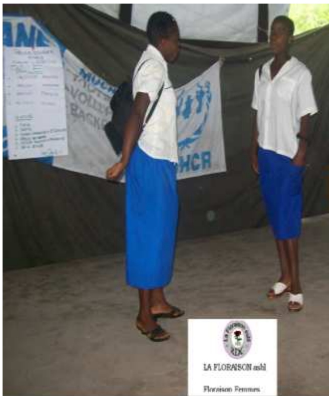
Elèves filles dénonçant les harcèlements sexuelles devant les autorités scolaires et autres membres de la communauté dans un sketch produit dans une occasion de promo-scolaire organisée par La Floraison dans l'Espace Culturel du Centre Lokole à Baraka.